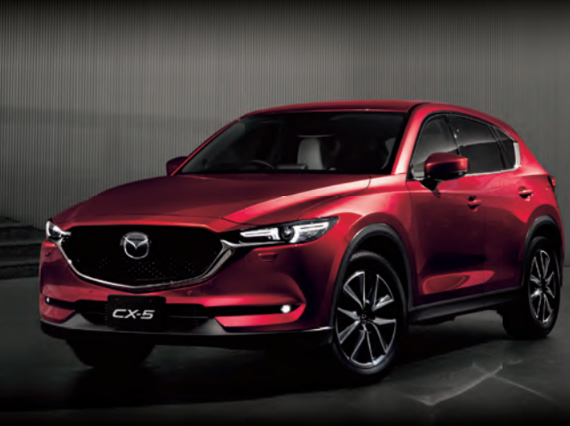
Body Color: ソウルレッドクリスタルメタリック

マツダが目指す理想に向けて、 ガソリンエンジン・ディーゼルエンジンともに 進化を遂げました。