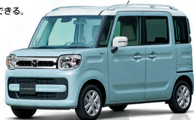
Body Color: オフブルーメタリック 2トーン (特別塗装色)

システムが衝突のおそれと判断すると、ブザー音などの警報によってドライバーに警告。衝突の可能性が高まると、自動で強いブレーキをかけ、衝突回避・被害軽減を図ります。