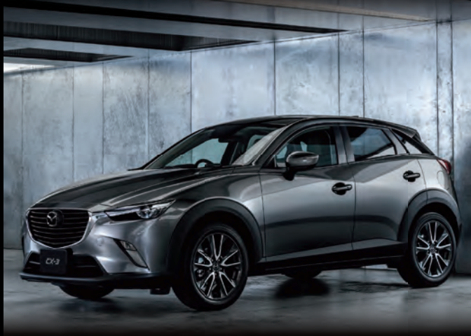
Body Color: マシングレープレミアムメタリック