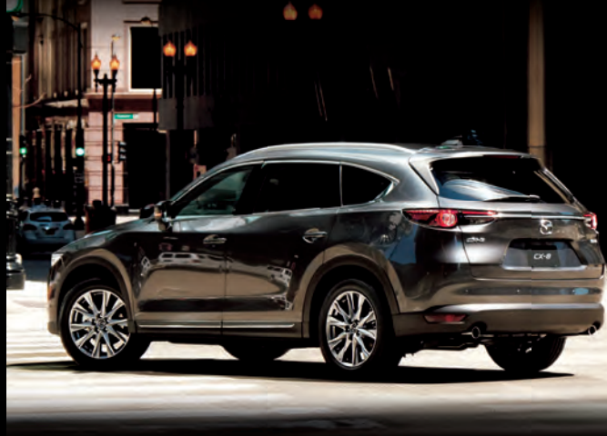
Body Color: マシングレープレミアムメタリック