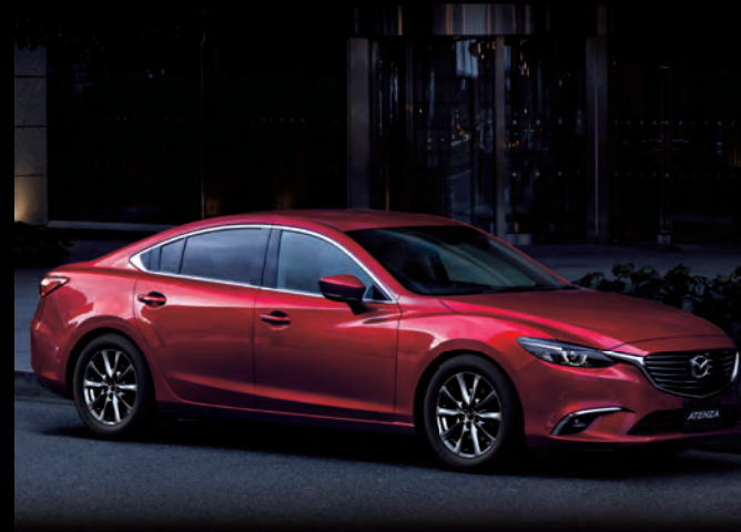
Body Color: ソウルレッドプレミアムメタリック