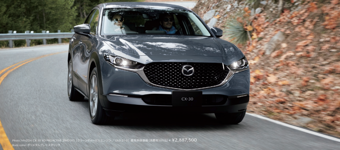
Photo:MAZDA CX-30 XD PROACTIVE 2WD (FF) [クリーンディーゼルエンジン / 663-21-0] 車両本体価格(消費税10%込) * ¥2,887,500 Body color:ソリメタルグレーメタリック