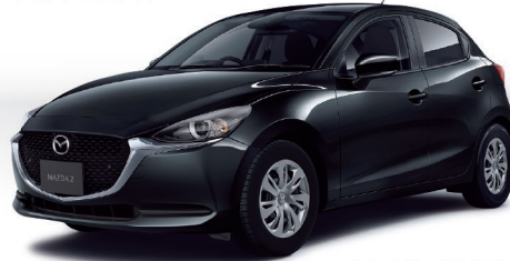
Body color:ジェットブラックマイカ