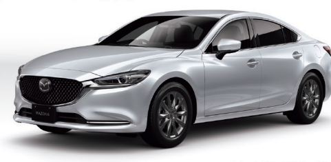
Body color:ソニックシルバーメタリック