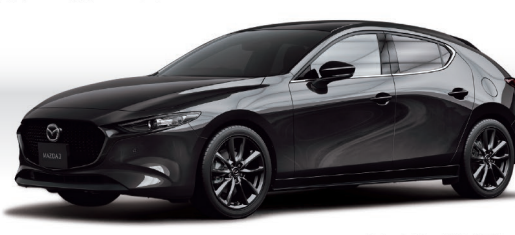
Body color:ジェットブラックマイカ