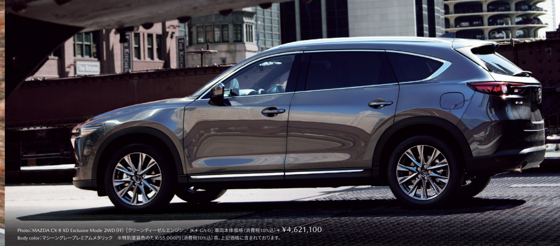
Photo:MAZDA CX-8 XD Exclusive Mode 2WD (FF) [クリーンディーゼルエンジン / 6K4-GA-0] 車両本体価格(消費税10%込) * ¥4,621,100 Body color:マシングレアッププレミアムメタリック ※特別塗装色のため55,000円(消費税10%込)高。上記価格に含まれております。