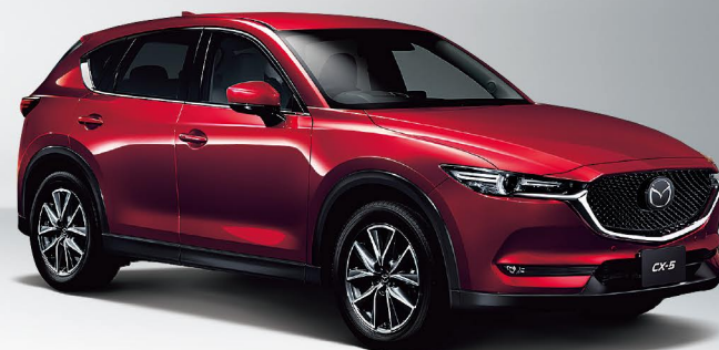
Body Color: ソウルレッドクリスタルメタリック