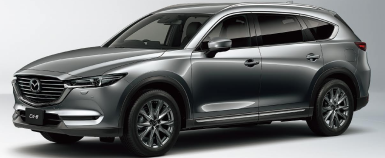
Body Color: マシーングレープレミアムメタリック