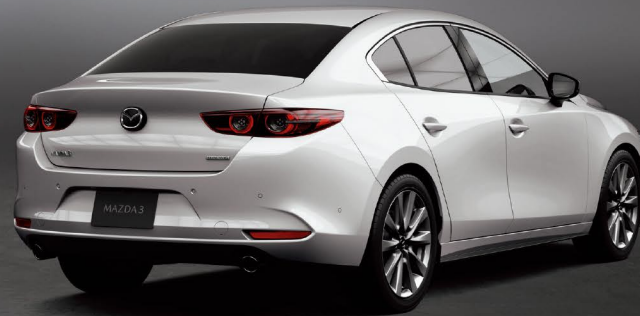
Body Color: スノーフレイクホワイトパールマイカ