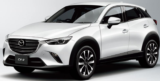
Body Color: スノーフレイクホワイトパールマイカ