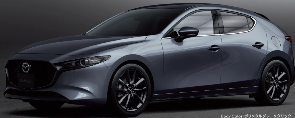
Body Color: ポリメタルグレーメタリック