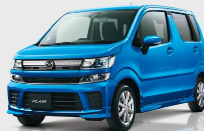
Body color: プリンスブルーメタリック