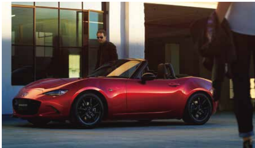
○掲載の支払例は、初回支払:2019年5月、ボーナス月:7月・12月、お支払い回数(期間):37回(ヶ月)、月間走行距離1,000kmタイプ、分割払手数料率(実質年率)2.99%で算出した一例です。○支払例は2019年3月時点での情報です。