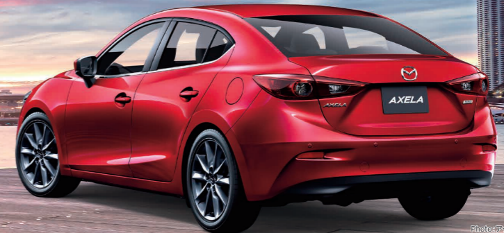
Photo:アクセラセダン 15XD L Package