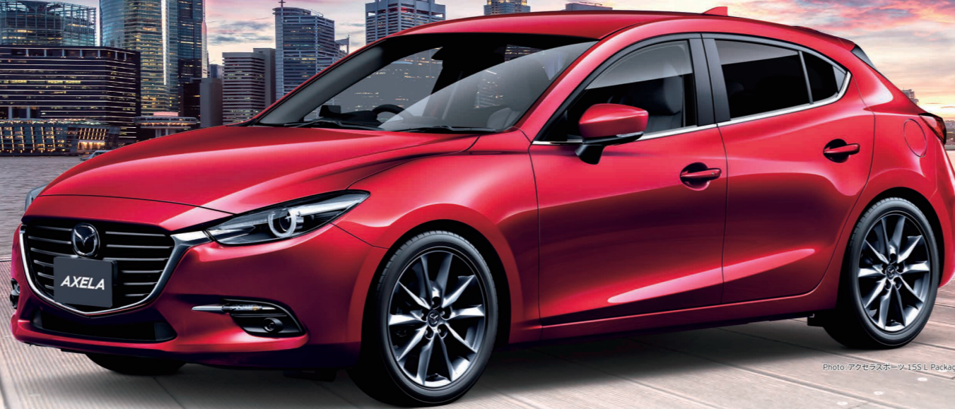
Photo:アクセラスポーツ 15S L Package

アクセラ全グレードに先進安全技術を標準装備。「セーフティ・サポートカーS(サポカーS)」のワイドに適應して登場。