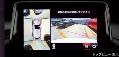
トップビュー表示