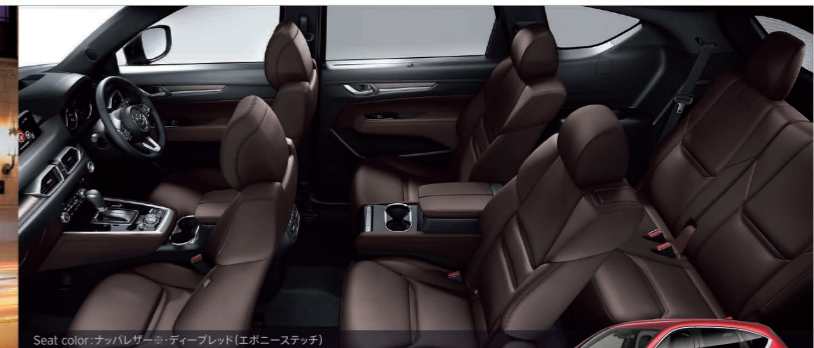
Seat color: ナッパレザー+ディープレッド(エゴニーステッチ)

エンジン SKYACTIV-D 2.2 トランスミッション SKYACTIV-DRIVE 乗車定員 6人 or 7人 全長 4,900×全幅 1,840×全高 1,730(mm)