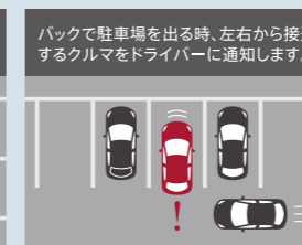
リア・クロス・トラフィック・アラート (RCTA)※2