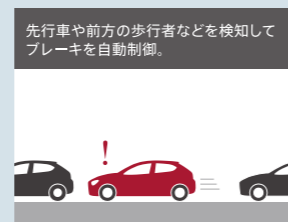
アドバンス・スマート・シティ・ブレーキ・サポート(アドバンスSCBS)※2

※2:i-ACTIVSENSE各技術は、ドライバーの安全運転を前提としたシステムであり、事故被害や運転負荷の軽減を目的としています。したがって、各機能には限界がありますので過信せず、安全運転を心がけてください。その他、重要な注意事項がございますので、営業スタッフにおたずねいただくか「取扱説明書」をご確認ください。 ※2:対象物、障害物の形状、接近車両の状況、隣接する壁や駐車車両の状態、天候状況、道路状況などの条件によっては適切に作動しない場合があります。