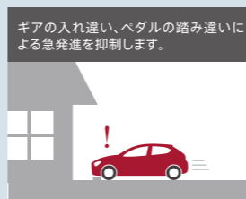
AT誤発進抑制制御 [前進時]※2