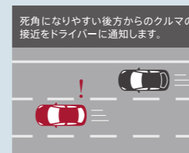
ブラインド・スポット・モニタリング (BSM)※2